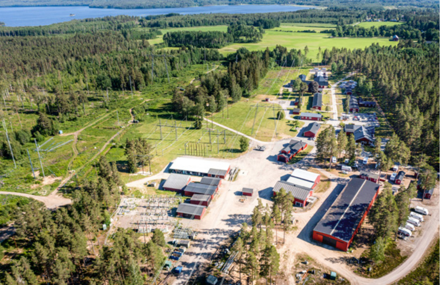
➤ Åsbro kursgård etablerades 1948 – då med fokus på civilpliktsutbildningar.